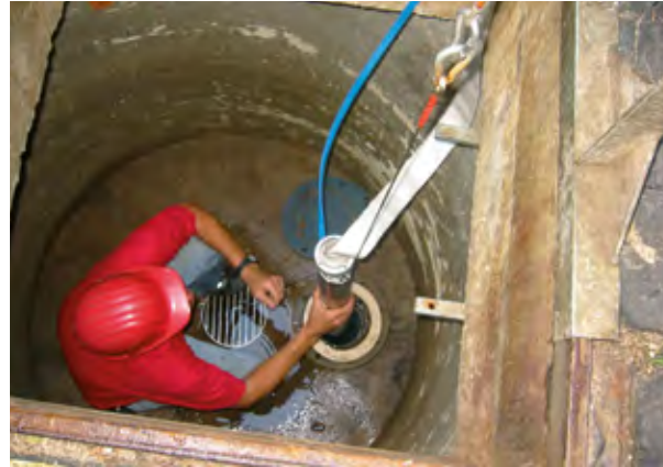
Einbau einer Unterwassermotorpumpe

Seit 1970 wurden vom Bund in Großstädten und Ballungsräumen über 5.000 Anlagen zur Trinkwasser-Notversorgung errichtet. Vom Grundsatz her sind Sie für den Einsatz in einem Verteidigungsfall vorgesehen, können allerdings jederzeit auch zur Abwendung anderer Gefahrensituationen verwendet werden. Diese Anlagen liefern Grundwasser aus Brunnen oder gefassten Quellen und arbeiten vollkommen unabhängig vom öffentlichen Wasserleitungsnetz. Zur Versorgung ländlicher Gebiete stehen zusätzlich Trinkwasserbehälter für den mobilen Einsatz sowie Verbundleitungen zur Verfügung. Alle Einrichtungen der Trinkwasser-Notversorgung sind vor Zerstörung oder Verunreinigung weitgehend geschützt und werden mindestens einmal jährlich überprüft. Ein turnusmäßiger Pumptest erfolgt alle 5 Jahre.