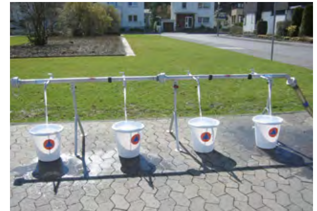
Verteilung von Trinkwasser

Im Notfall wird das Wasser an Zapfstellen zur Verfügung gestellt und von der Bevölkerung mit Eimern oder Kanistern geholt. Der lebensnotwendige Wasserbedarf von 15 Litern pro Tag und Person kann über einen Zeitraum von 14 Tagen bereitgestellt werden. Gegenüber normalem Trinkwasser weist das Wasser der Trinkwasser-Notversorgung erhöhte chemische Richtwerte auf. Diese sind jedoch in Anbetracht der kurzen Nutzungszeit unbedenklich. Die Wasserqualität der Notbrunnen wird regelmäßig untersucht. Zur Entkeimung des Brunnenwassers werden an der Abgabestelle zusätzlich Desinfektionstabletten zugegeben.